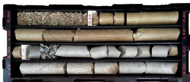
mod. EMIRATI Ø 101 - 4 COMPARTI