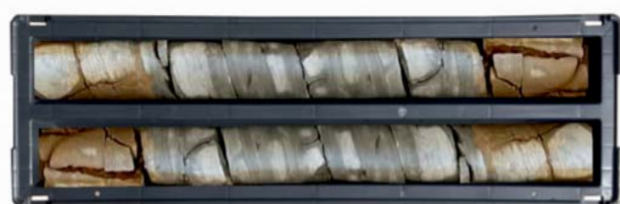
mod. FRANCIA Ø 116 - 2 COMPARTI