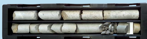
mod. FRANCIA Ø 101 - 2 COMPARTI