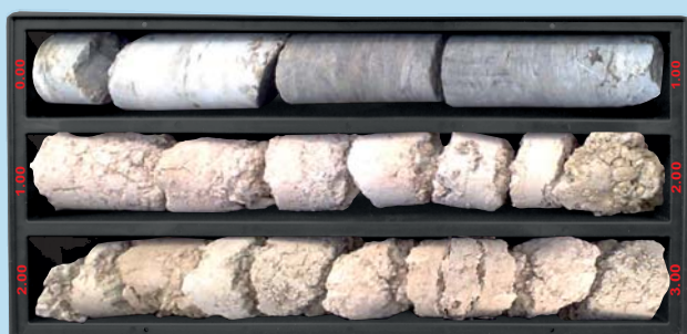
mod. EUROPA Ø 131 - 3 COMPARTI