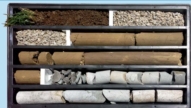
mod. ITALIA Ø 101 - 5 COMPARTI